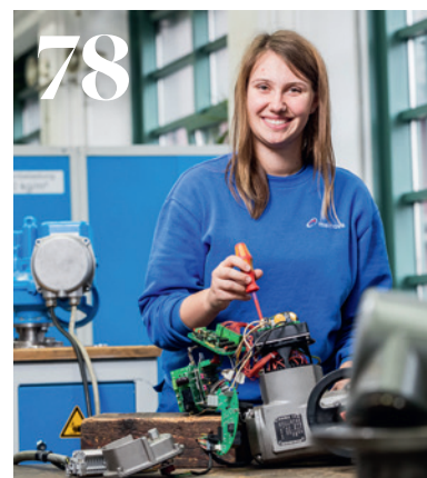
Titel Quelle: DVGW 14 Zur Wasserstofftauglichkeit von Stahlwerkstoffen für Gasleitungen 46 Sicherung von Dükern mithilfe von Spezialmatten aus Unterwasserbeton 50 Personalmanagement in Versorgungsunternehmen im Zuge der Digitalisierung 78 Ich mach was mit ...