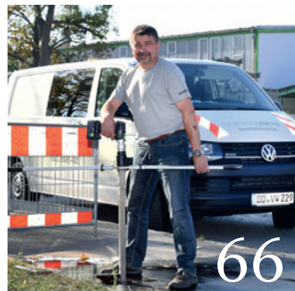
Titel Quelle: wvgw 16 Überarbeitung des Abschnitts 5.7 der DVGW-TRGI 2018 28 Notfallvorsorgeplanung in der Trinkwasserversorgung 52 Klimaschutz mit grünen Gasen 66 Ich mach was mit ...